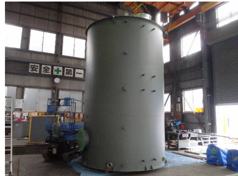
25KL屋外重油タンク φ2,800 * 4,500H