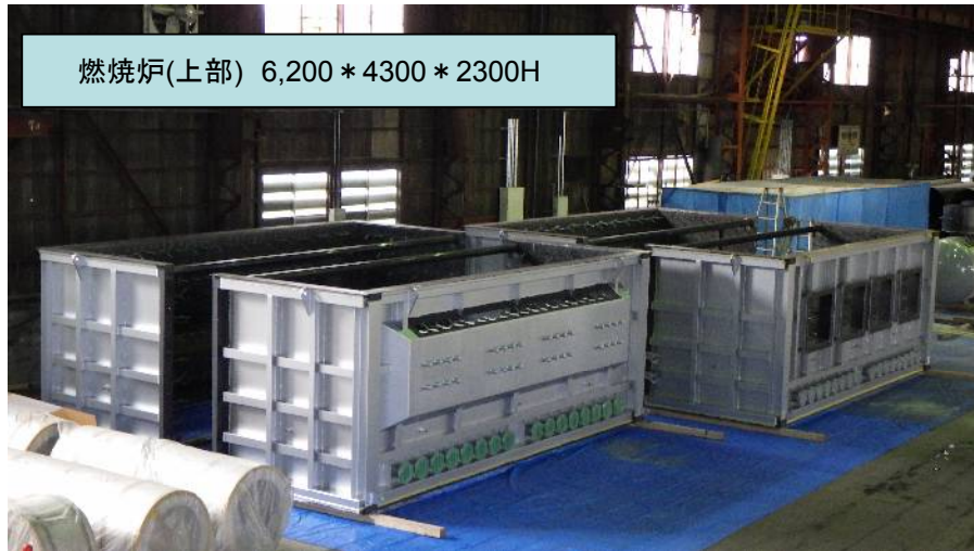
燃焼炉(上部) 6,200 * 4300 * 2300H