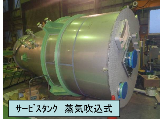
サービスタンク 蒸気吹込式