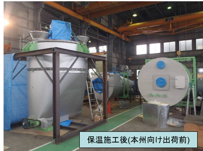
保温施工後(本州向け出荷前)

伊藤製缶工業株式会社 札幌市西区発寒14条13丁目2-1 TEL(011)661-7181 URL: http://www.ito-seikankogyo.co.jp//