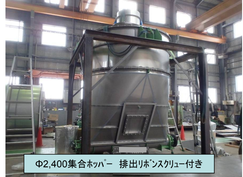
Φ2,400集合ホッパー 排出リボンスクリュー付き