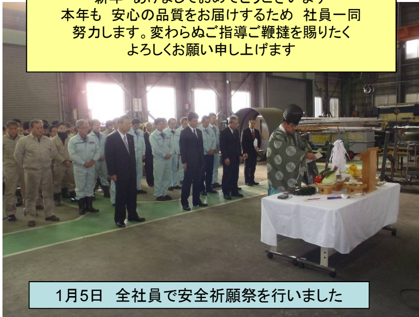
1月5日 全社員で安全祈願祭を行いました

新年 あけましておめでとうございます 本年も 安心の品質をお届けするため 社員一同 努力します。変わらぬご指導ご鞭撻を賜りたく よろしくお願い申し上げます