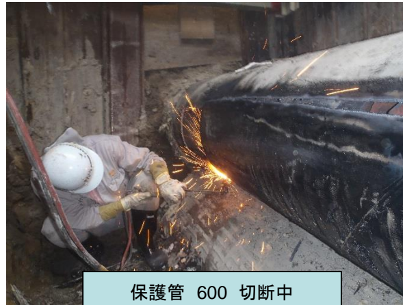
保護管 600 切断中