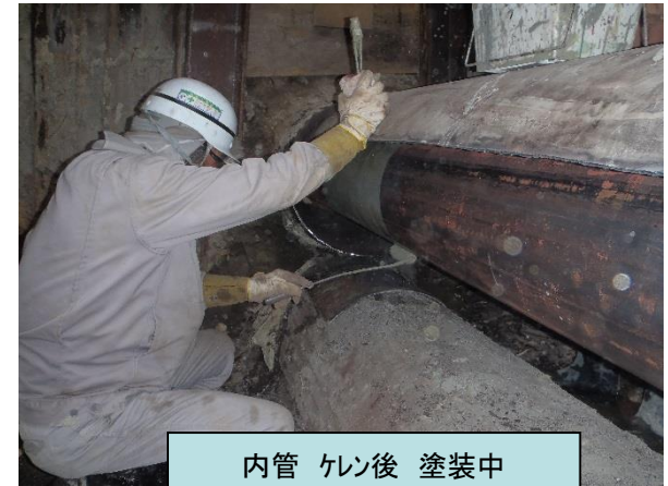
内管 ケン後 塗装中

8月は北海道でも暑い日が続きました。しかし 夏場は冬に備えて地中埋設管の維持・補修工事が最盛期になります。