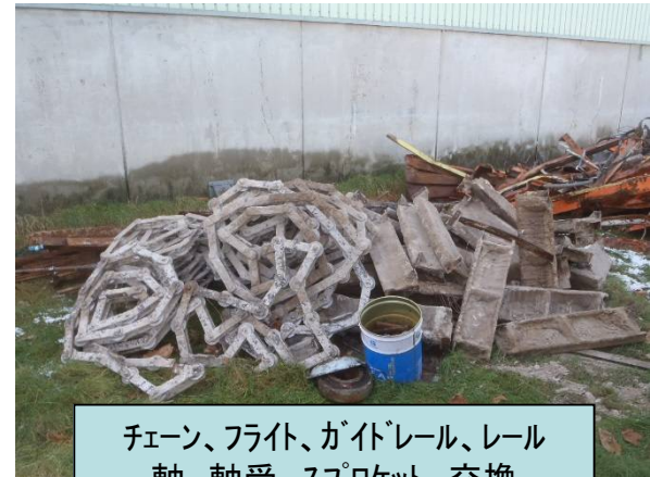
チェーン、フライト、ガイドレール、レール 軸、軸受、スプロケット 交換

伊藤製缶工業株式会社 札幌市西区発寒14条13丁目2-1 TEL(011)661-7181 URL: http://www.ito-seikankogyo.co.jp/