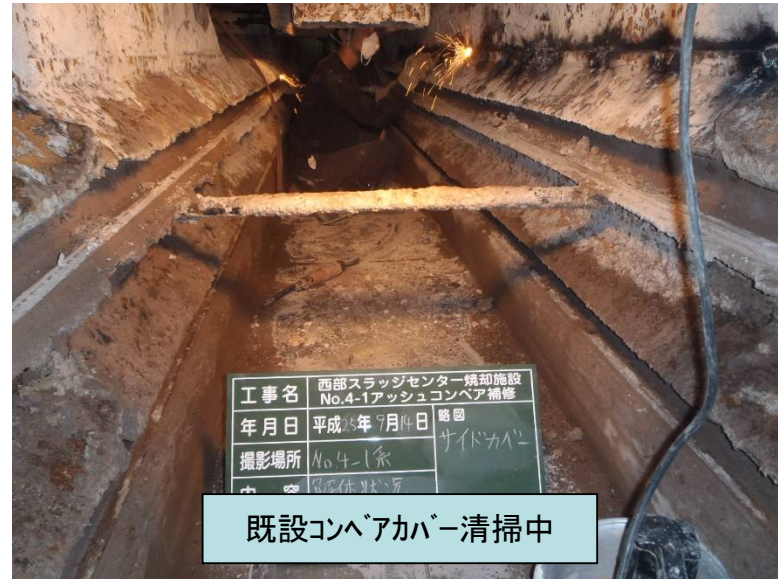
既設コンベアカバー清掃中

焼却施設アッシュコンベア修繕工事 施工完了 (財)札幌市下水道資源公社 様 から 修繕工事を 請負ました W1,020×15,300L