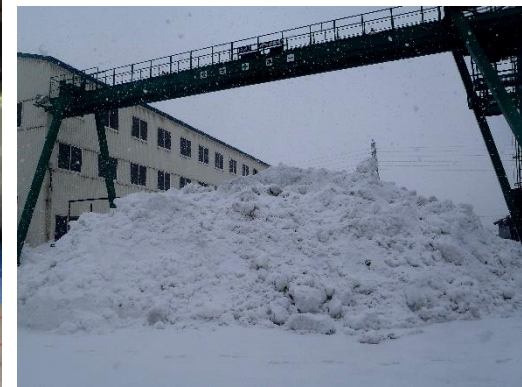
札幌の過去5年間の平均降雪量 458cm この冬は 2月末迄で 518cm との事 やはり 今年の雪は 多いです