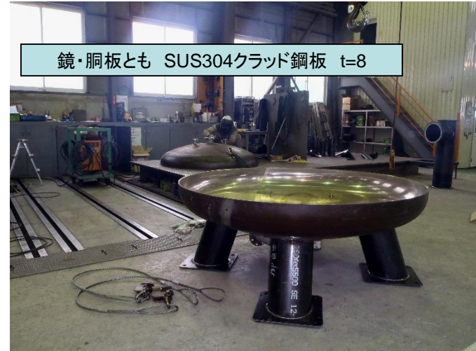
8,000ℓ ストレージタンクを製作させて頂きました