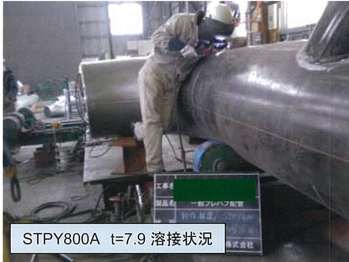
STPY800A t=7.9 溶接状況