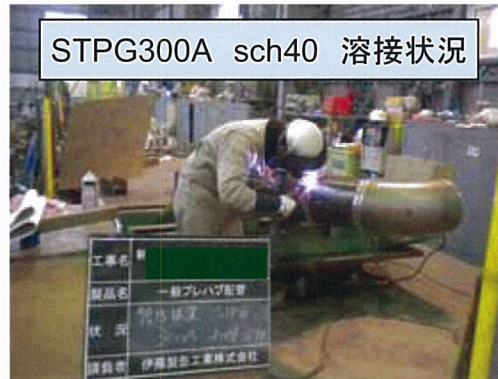
STPG300A sch40 溶接状況