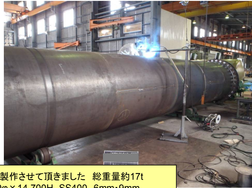
煙突 製作させて頂きました 総重量約17t 1,900φ×14,700H SS400 6mm・9mm 内面 キャスタブルライニング t=50mm