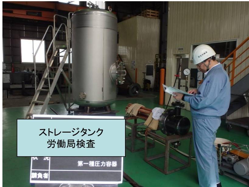
ストレージタンク 労働局検査