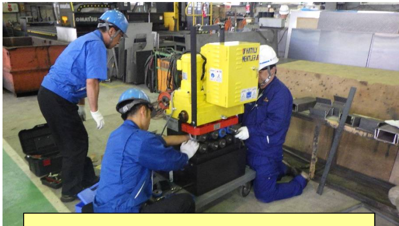
開先加工機を追加導入いたしました

東北、道東方面の皆様 台風による被害を 受けられた皆様 心からお見舞い 申し上げます。