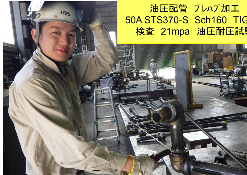
油圧配管 プレハブ加工 50A STS370-S Sch160 TIG3層 検査 21mpa 油圧耐圧試験