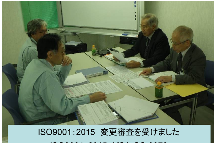
ISO9001:2015 変更審査を受けました ISO9001:2015 MSA-QS-3972 圧力容器、熱交換器、塔槽及び貯槽の設計製作 (施工部門を除く)