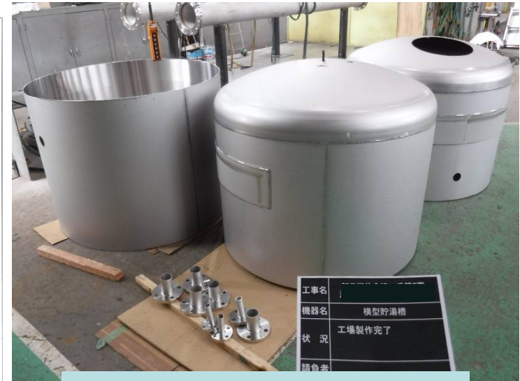
現場組横型貯湯槽 工場製作完了