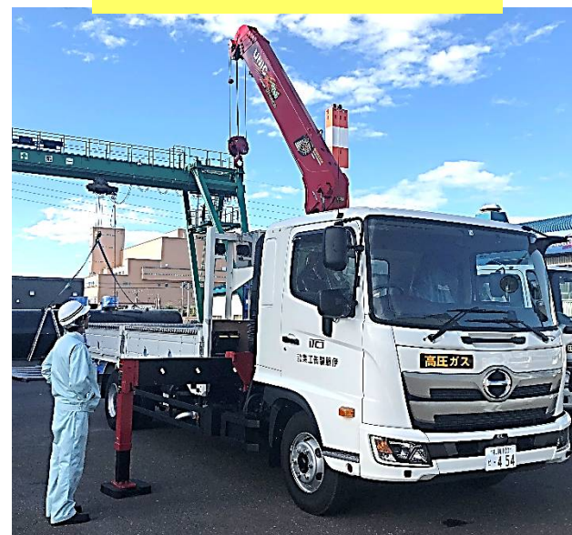
4トンユニック車を購入致しました

活性炭濾過タンク更新の製作、据付工事を させていただきました SUS304 φ600*1,480H 内面#400研磨