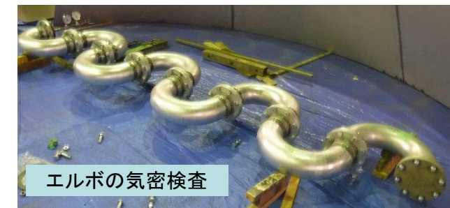
エルボの気密検査