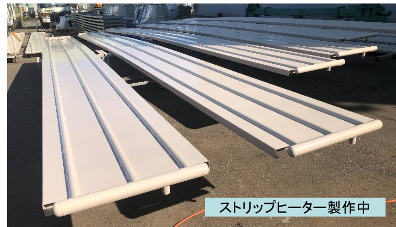
ストリップヒーター製作中