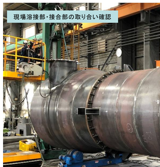
現場溶接部・接合部の取り合い確認