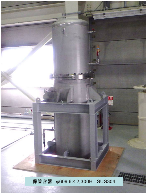
保管容器 φ609.6×2,300H SUS304