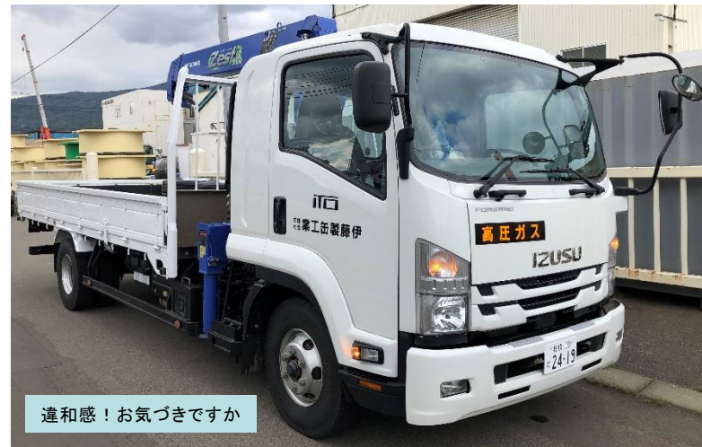
違和感！お気づきですか

伊藤製缶工業株式会社 札幌市西区発寒14条13丁目2-1 TEL(011)661-7181 URL: http://www.ito-seikankogyo.co.jp