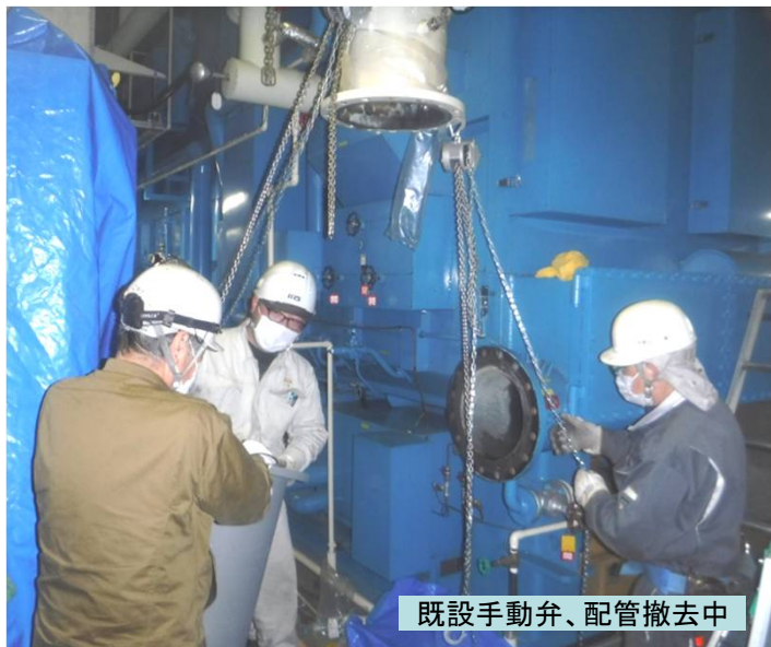
既設手動弁、配管撤去中