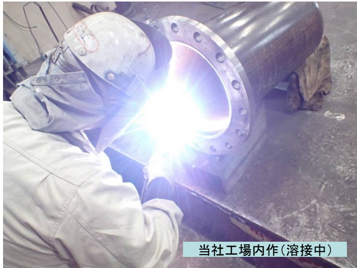
当社工場内作(溶接中)