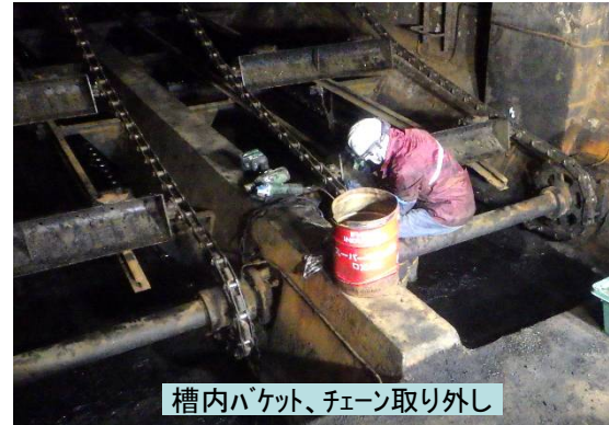
槽内バケツ、チェーン取り外し

2022年度新入社員 高等技術専門学院卒1名 を迎え新年度をスタート致しました 「皆様のお役に立てるよう」社員一同頑張ります