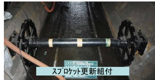
スプロケット更新組付