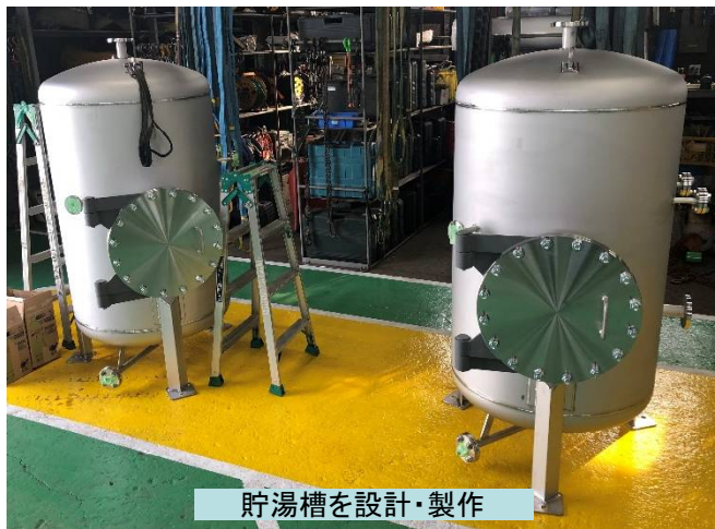
貯湯槽を設計・製作

札幌市様発注 当社元請工事 茨戸中部中継ポンプ場No4汚水沈砂掻揚機ほか修繕工事 茨戸西部中継ポンプ場No1沈砂掻揚機ほか修繕工事 2案件 施行させて頂きました