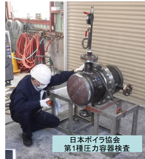
日本ボイラ協会 第1種圧力容器検査