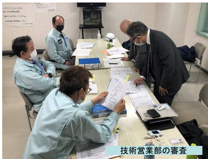
技術営業部の審査