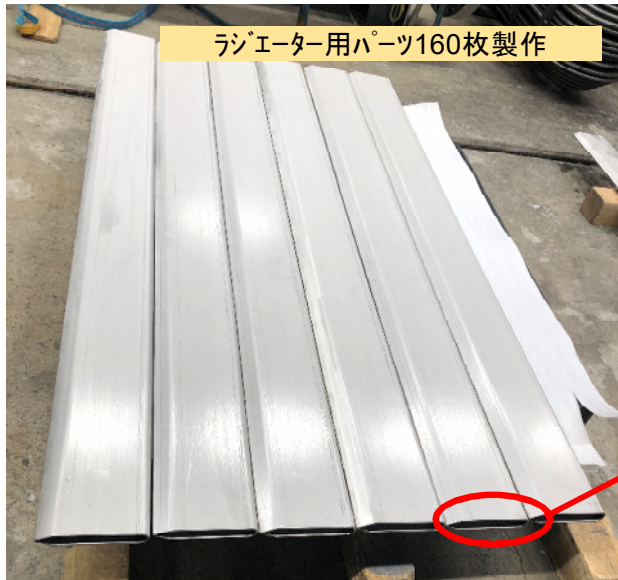
ラジエーター用パーツ160枚製作