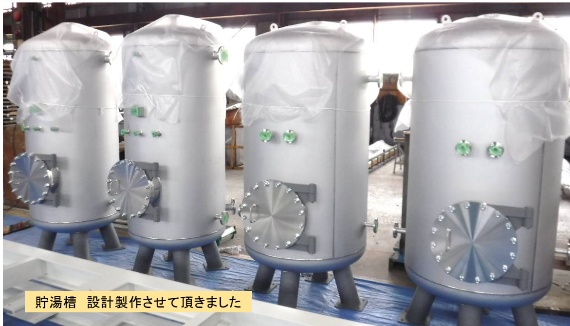
貯湯槽 設計製作させて頂きました