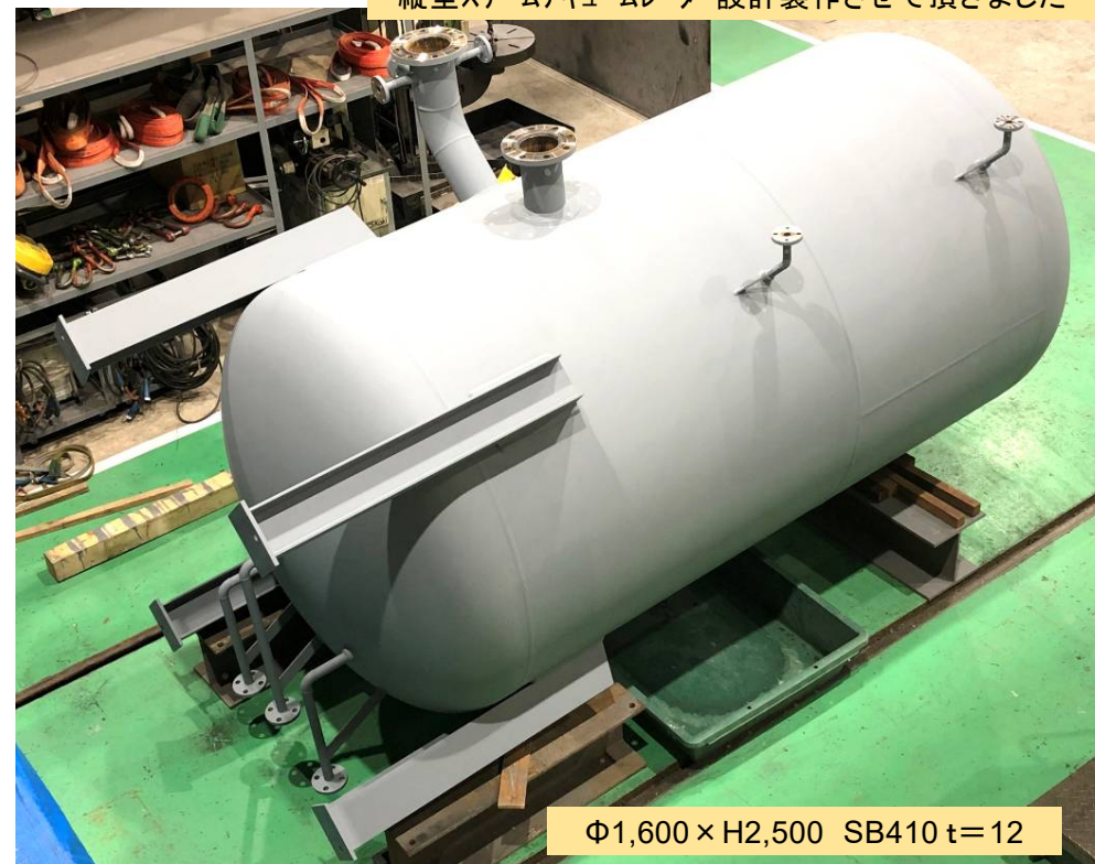
縦型スチームアキュムレーター設計製作させて頂きました

明けましておめでとうございます 今年も皆様にとって使い勝手の良い企業であるために 社員一同精進いたします。変わらぬご愛顧のほど 何卒よろしくお願い申し上げます。