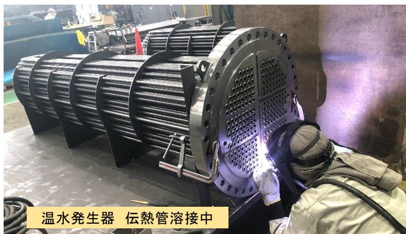
温水発生器 伝熱管溶接中