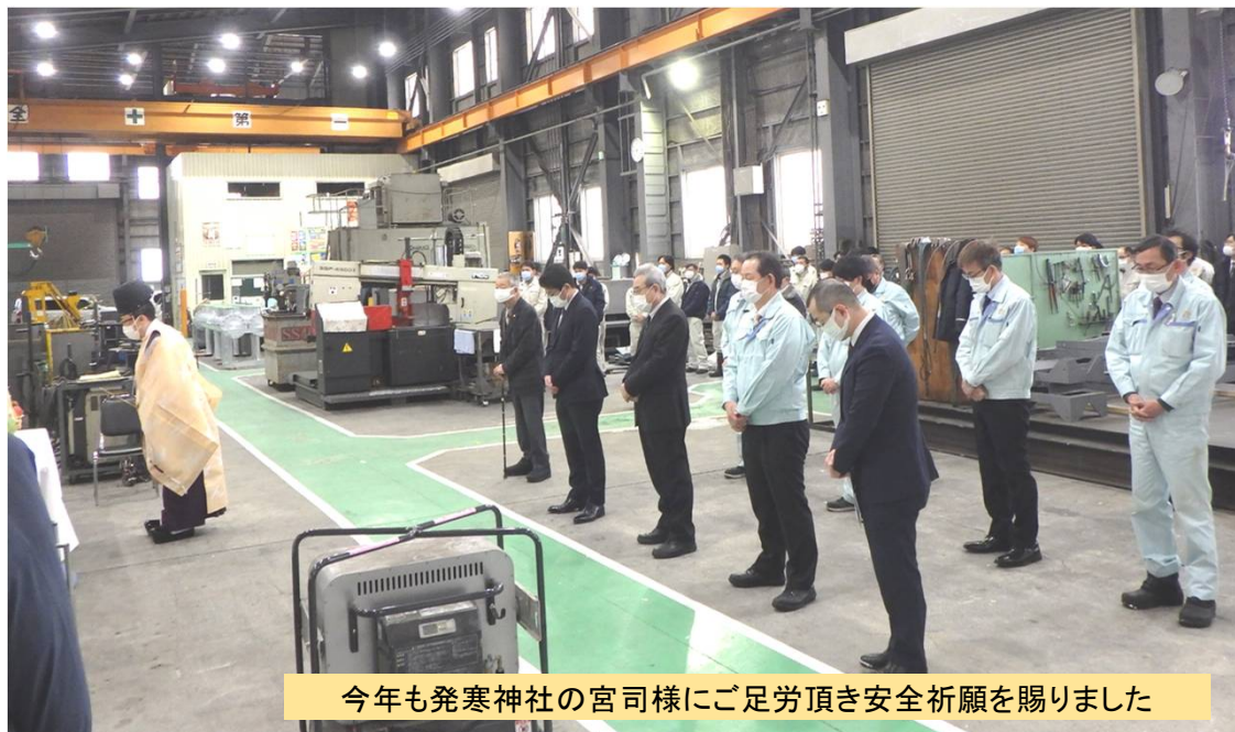
今年も発寒神社の宮司様にご足労頂き安全祈願を賜りました

明けましておめでとうございます 今年も皆様にとって使い勝手の良い企業であるために 社員一同精進いたします。変わらぬご愛顧のほど 何卒よろしくお願い申し上げます。