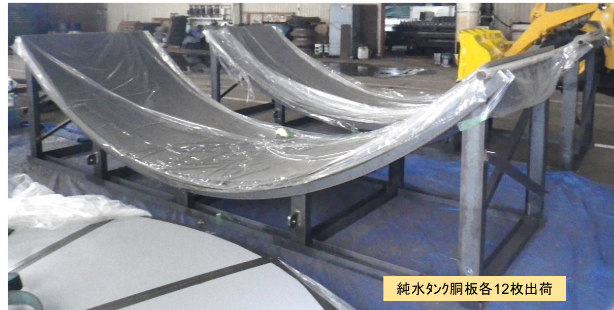
純水タンク銅板各12枚出荷