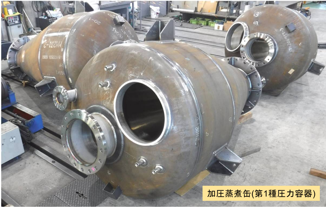
加圧蒸煮缶(第1種圧力容器)