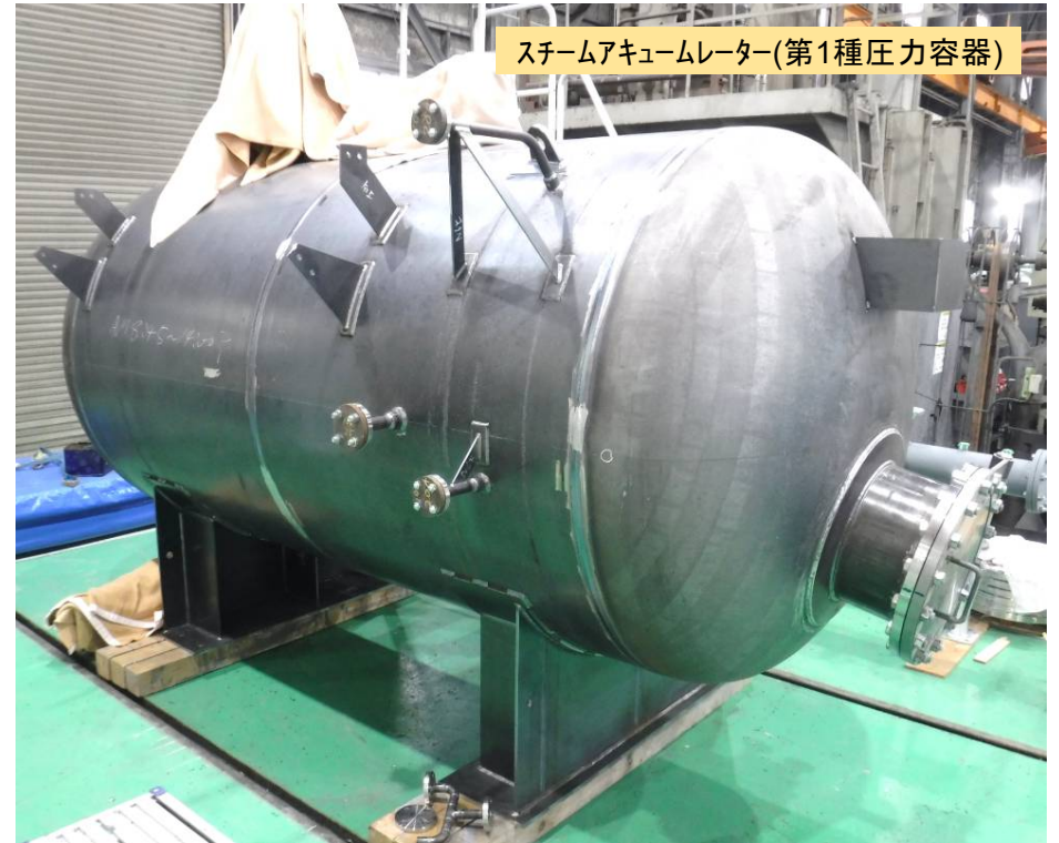
スチームアキュムレーター(第1種圧力容器)

某飼料工場様向け 加圧蒸煮缶SUS304クワット 3缶 スチームアキュムレーターSB410 6.0m 3 ドレンセパレーター 集合ホッパー 蒸気ヘッター 減圧ユニット 設計製作させて頂きました