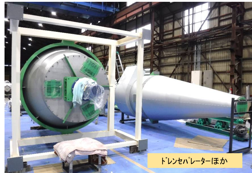
ドレンセパレーターほか