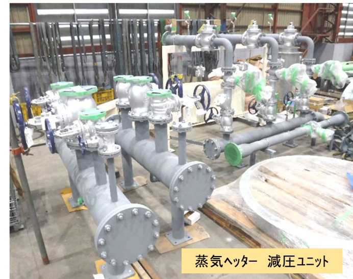
蒸気ヘッター 減圧ユニット