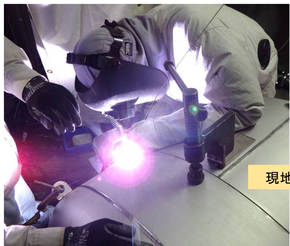
現地組立・溶接状況

SUS304製 昆布だし製造用タンク(ジャケット構造) SUS444製 貯湯槽(現場組) 搬入経路、設置場所とも狭いなかで施工させて頂くために 十分な事前調査を反映した設計を行い、現場施工させて頂きました