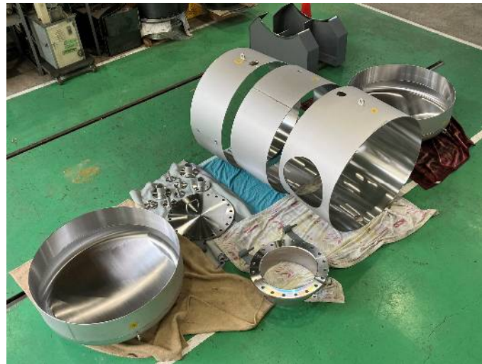
現場組貯湯槽を工場で半加工