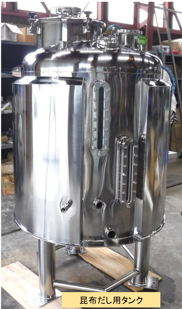
昆布だし用タンク