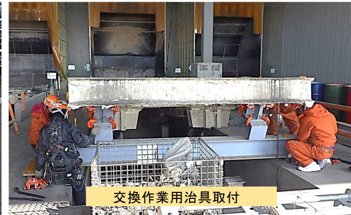
交換作業用治具取付

トラックダンパー用シリンダーの交換作業 させて頂きました (テーブル寸法 2,990×12,710mm)