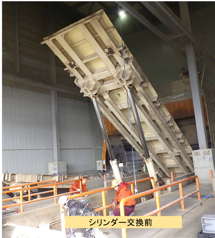
シリンダー交換前