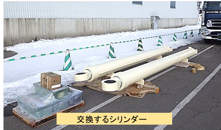
交換するシリンダー