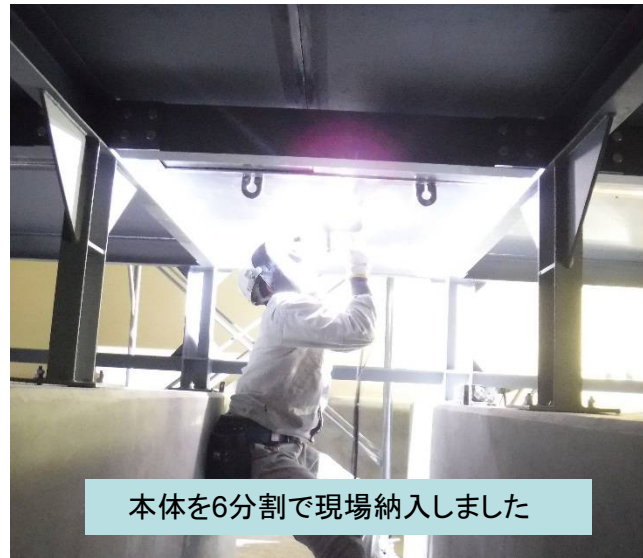
本体を6分割で現場納入しました