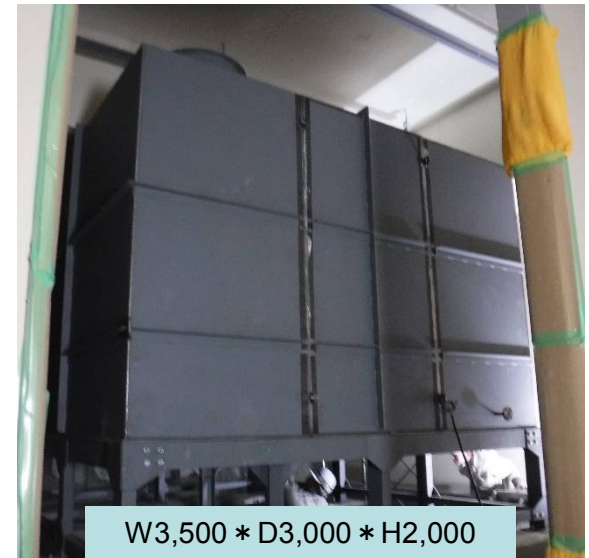
W3,500 * D3,000 * H2,000 現場で消防検査を受検